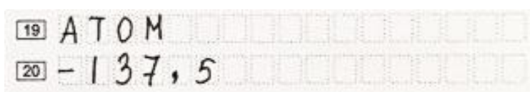
Рис. 1. Образец заполнения полей на бланке ответов № 1

Ответ на задание с кратким ответом нужно записать в такой форме, в которой требуется в инструкции к данному заданию (или группе заданий), размещенной в КИМ перед соответствующим заданием или группой заданий (рис. 1).